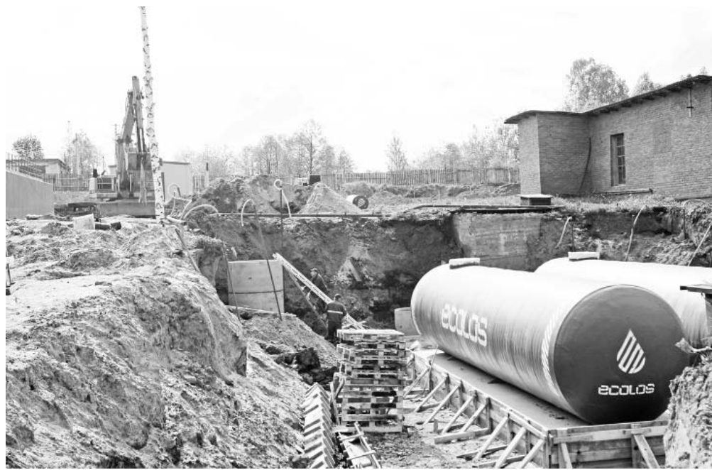
На очистных сооружениях в п.Думиничи.