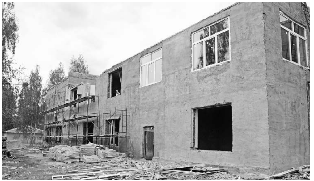
Капремонт Новослободского ДК.

они готовы ими обеспечить хоть всю область.